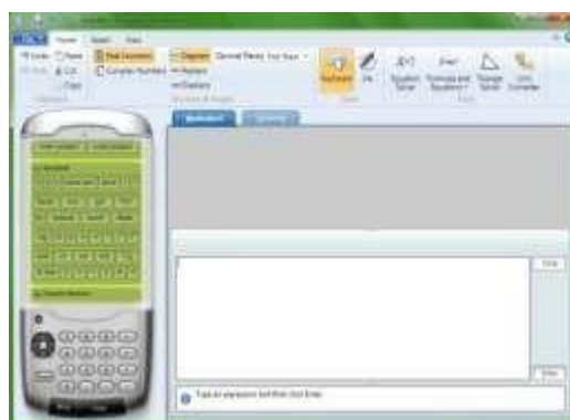
Gambar. Tampilan Microsoft Mathematic

Software pembelajaran yang kedua adalah Microsoft Mathematics . Berikut disajikan tampilan awal program pembelajaran Microsoft Mathematics